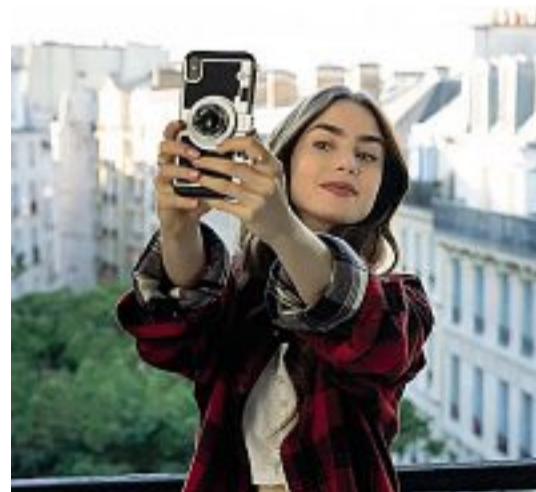
Lily Collins, protagonista della serie tv «Emily in Paris» che rappresenta i CreActives, uno dei nuclei della GenZ

Per essere radicali e immediati nel sentire, come loro desiderano, bisogna praticare le regole del sincretismo culturale, creando connessioni inaspettate tra mondi diversi: design, architettura, arte, moda. La rete di oggetti e servizi che essi tendono