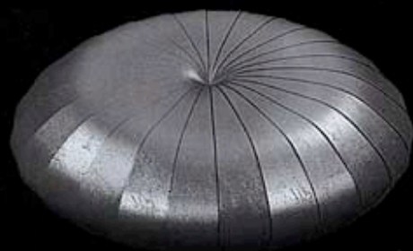
Il pouf Esedra disegnato da Monica Förster per Poltrona Frau: pelle cucita a mano con effetto plissettato

sensoriale diventa quindi una porta su un mondo interno sempre più affascinante, che ha trasformato l'edonismo degli anni '80 in una fonte di scoperta delle proprie potenzialità attraverso le piccole cose quotidiane. Il desiderio di armonia tra mondo interno e mondo esterno attribuisce agli oggetti della vita quotidiana un ruolo di stimolo per scoprire nuove possibilità. Il design applicato alla semplicità degli oggetti quotidiani produce effetti 'magici' che stupiscono e conquistano. La ricerca dell'armonia con il proprio ambiente e dell'edonismo nel quotidiano si esprime, ad esempio, attraverso nuove proposte che assumono le caratteristiche del benessere creativo, nuova forma di lusso. Il consumatore avanzato desidera immergersi in nuovi mondi dove è possibile sentire e percepire con intensità. I nuovi prodotti legati all'area del design per il benessere facilitano questa esperienza sensoriale e propongono percezioni contigue. Nell'ambiente di vita prevalgono paesaggi visivi e tattili, che vengono composti con grande cura proponendo una centralità dell'esperienza corporea, aiutando ad intensificare attraverso il design la percezione dello spazio circostante.