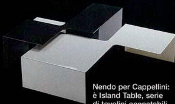
Nendo per Cappellini: è Island Table, serie di tavolini accostabili