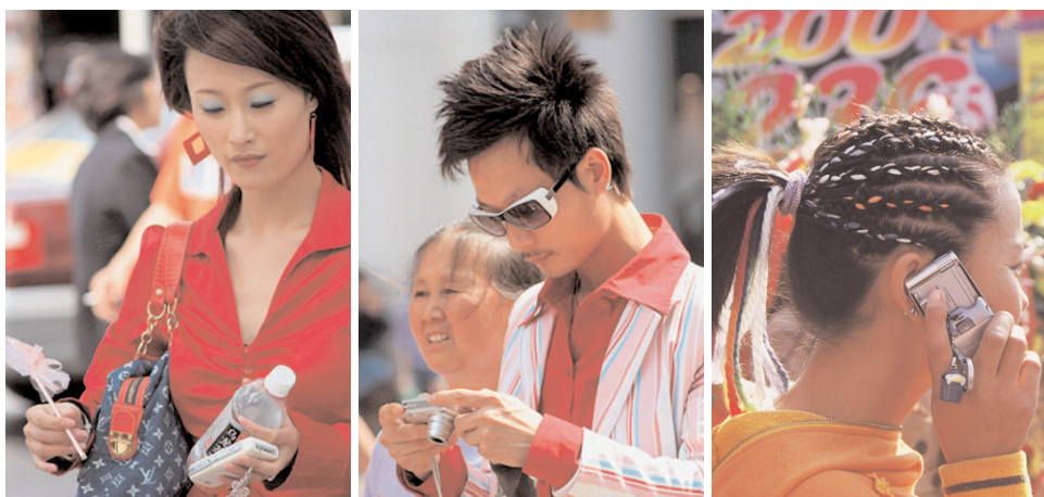
Cina - Street Signals Program

Nel corso della giornata di studio e di lavoro verranno esplorate e messe a fuoco le tendenze in atto nei comportamenti di consumo, utilizzando la conoscenza del mercato cinese come laboratorio per nuovi progetti innovativi .