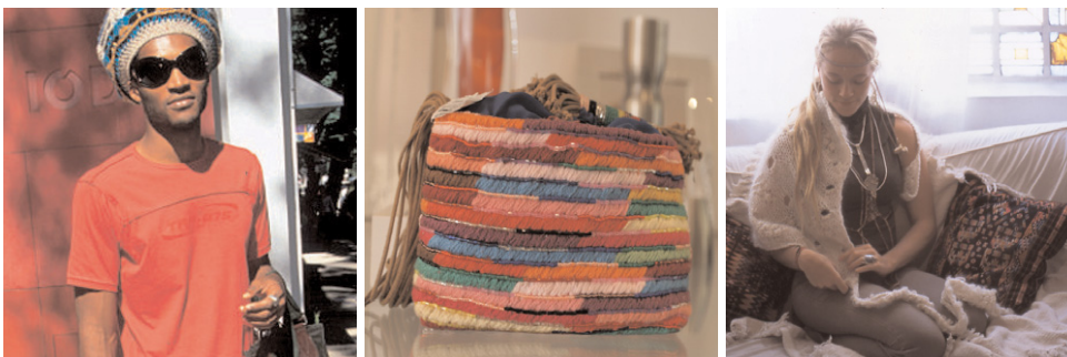
Brasile - Street Signals Program

La giornata di seminario di lunedì 7 aprile, attraverso gli interventi di Francesco Morace e del team di ricercatori di Future Concept Lab, presenterà lo scenario socioculturale e le tendenze a livello internazionale, nonché i concetti e le parole chiave con le quali confrontarsi nel mondo della nuova globalizzazione.